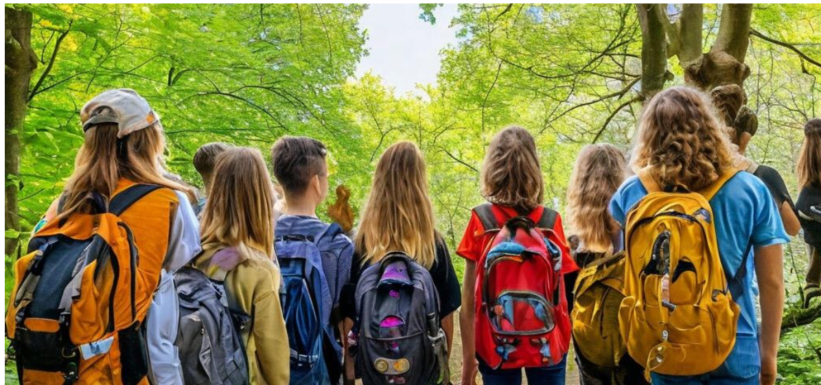
Выходы за пределы школы